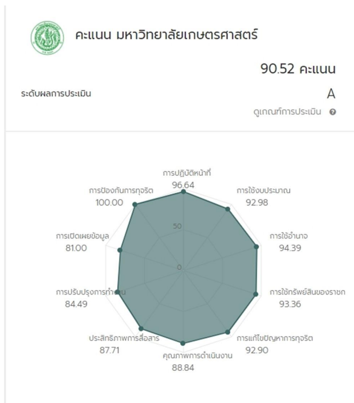
แผนภาพที่ 1 ผลการประเมินคุณธรรมและความโปร่งใสในการดำเนินงานของมหาวิทยาลัยเกษตรศาสตร์ ปีงบประมาณ พ.ศ. 2565

รายละเอียดของคะแนนในแต่ละตัวชี้วัด ดังแผนภาพที่ 1 และตารางที่ 1